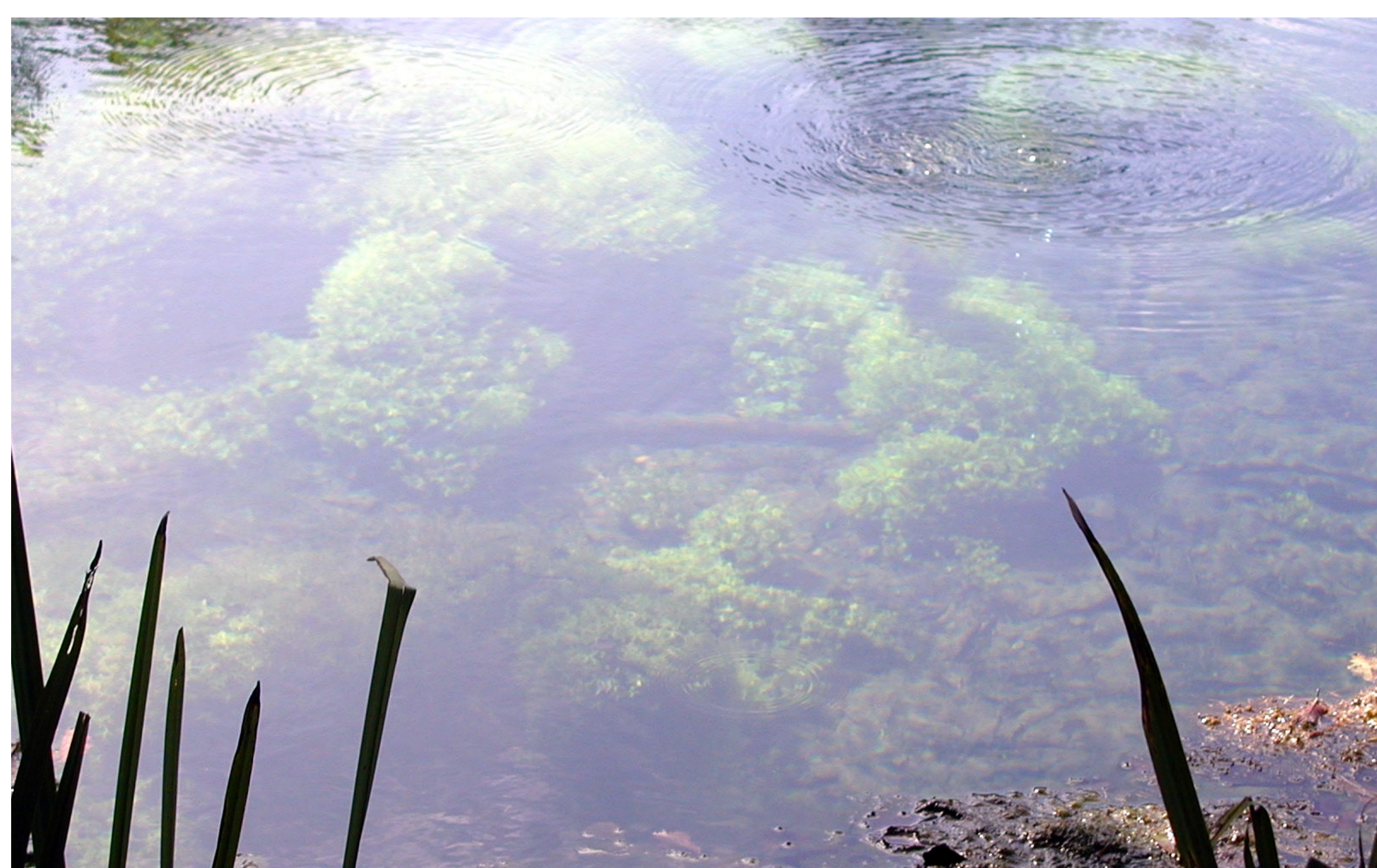
Surxencias de Fonmiñá, unha das nacentes do río Miño

A "Fonte Sacra" da Fonsagrada. Conta a lenda que unha noite chegou un peregrino moi canso ao que ninguén daba refuxio. Unha viúva moi pobre acolleuno na súa casa e deulle o único que tiña para comer, pan negro e nabos. Cando volveu de buscar unha xerra de auga da fonte atopou con que a auga se convertera en leite e na mesa tiña un bolo de pan e o peregrino desaparecera. Desde aquela a fonte chámase "Fonse Santa" e dalle nome á Fonsagrada.