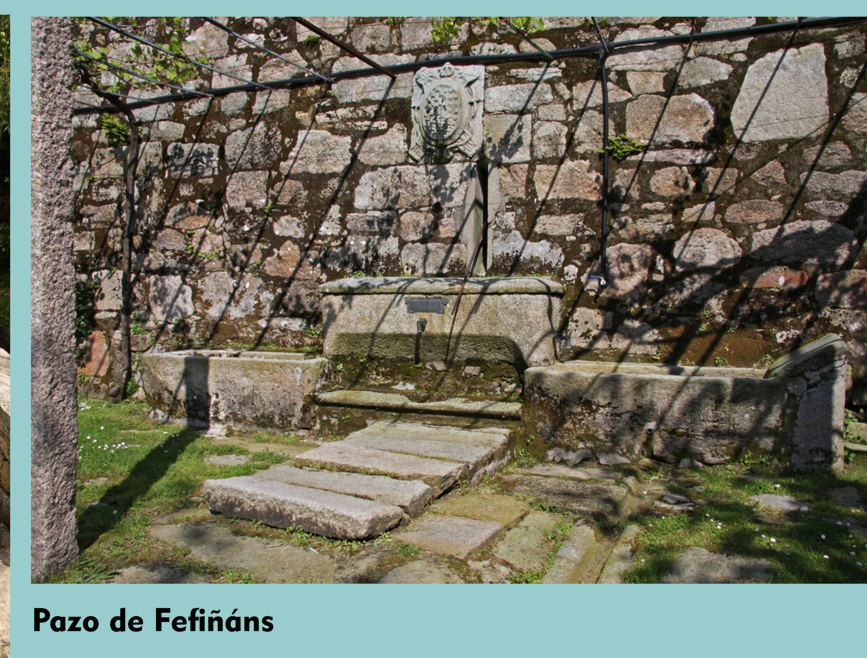
Pazo de Fefiñáns