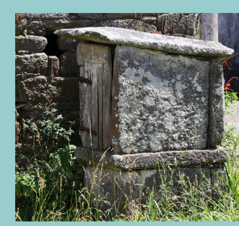
San Fins (Vimianzo)