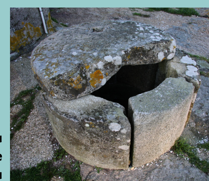
Foro da Illa de Arousa