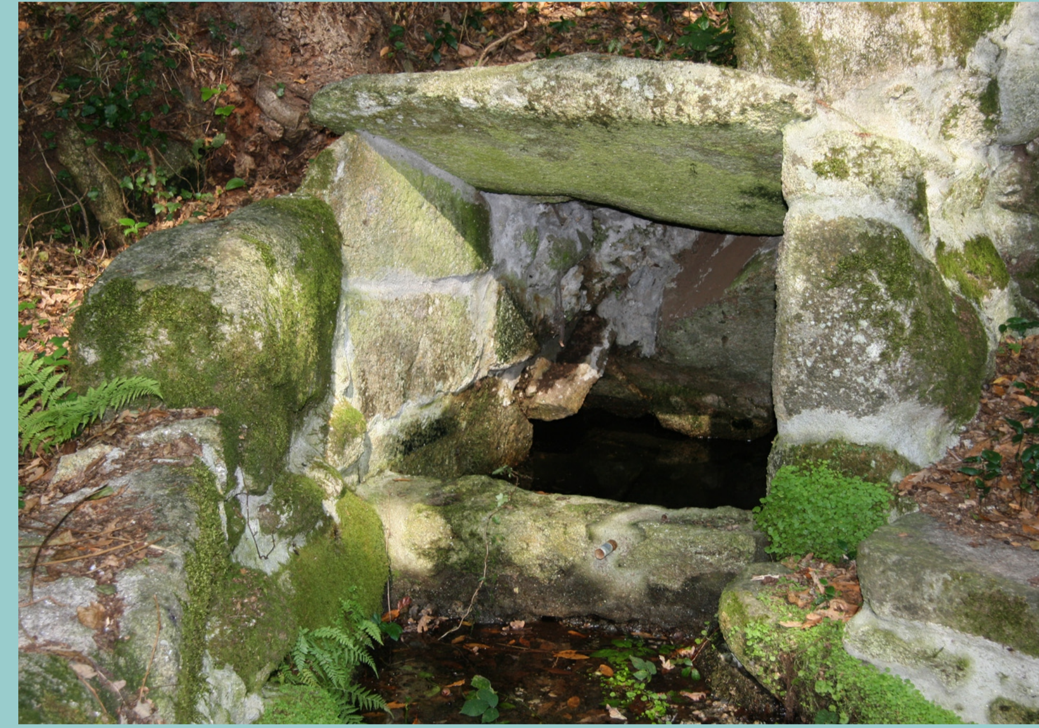
Mina en Trandeiras

Os pozos antigos revestíanse interiormente de pedra e, en ocasións, contaban con chanzos ou escadas para poder baixar a eles e realizar traballos de limpeza e mantemento.