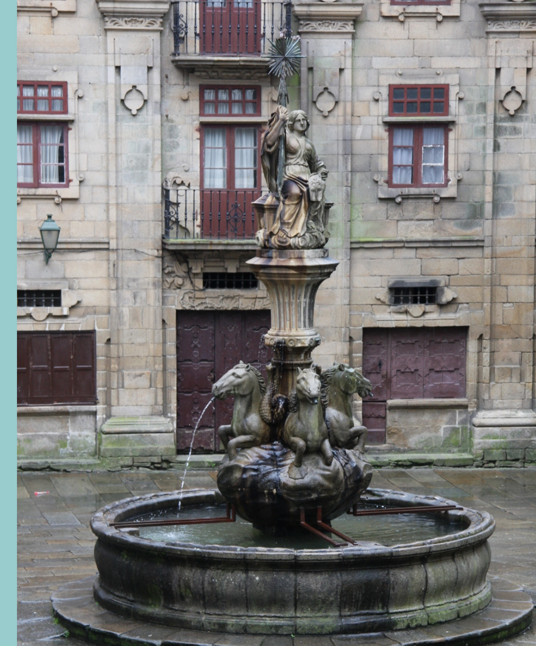
As Platerías Santiago de Compostela