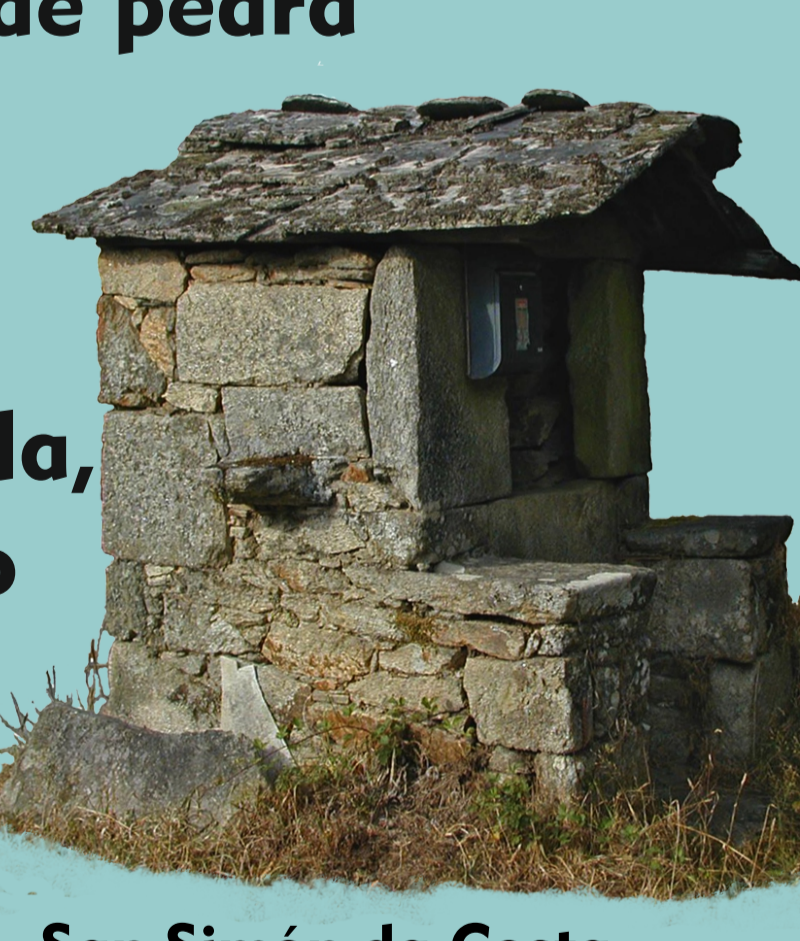
San Simón da Costa

Os pozos de abastecemento das casas rodéanse, como protección, con peitorís de pedra cilíndricos ou prismáticos e nalgúns zonas van cubertos cun tellado posto sobre catro esteos ou cunha caseta pechada, cun pousadoiro para o caldeiro ou balde, ao pé da que pode haber tamén unha pía ou lavadoiro.