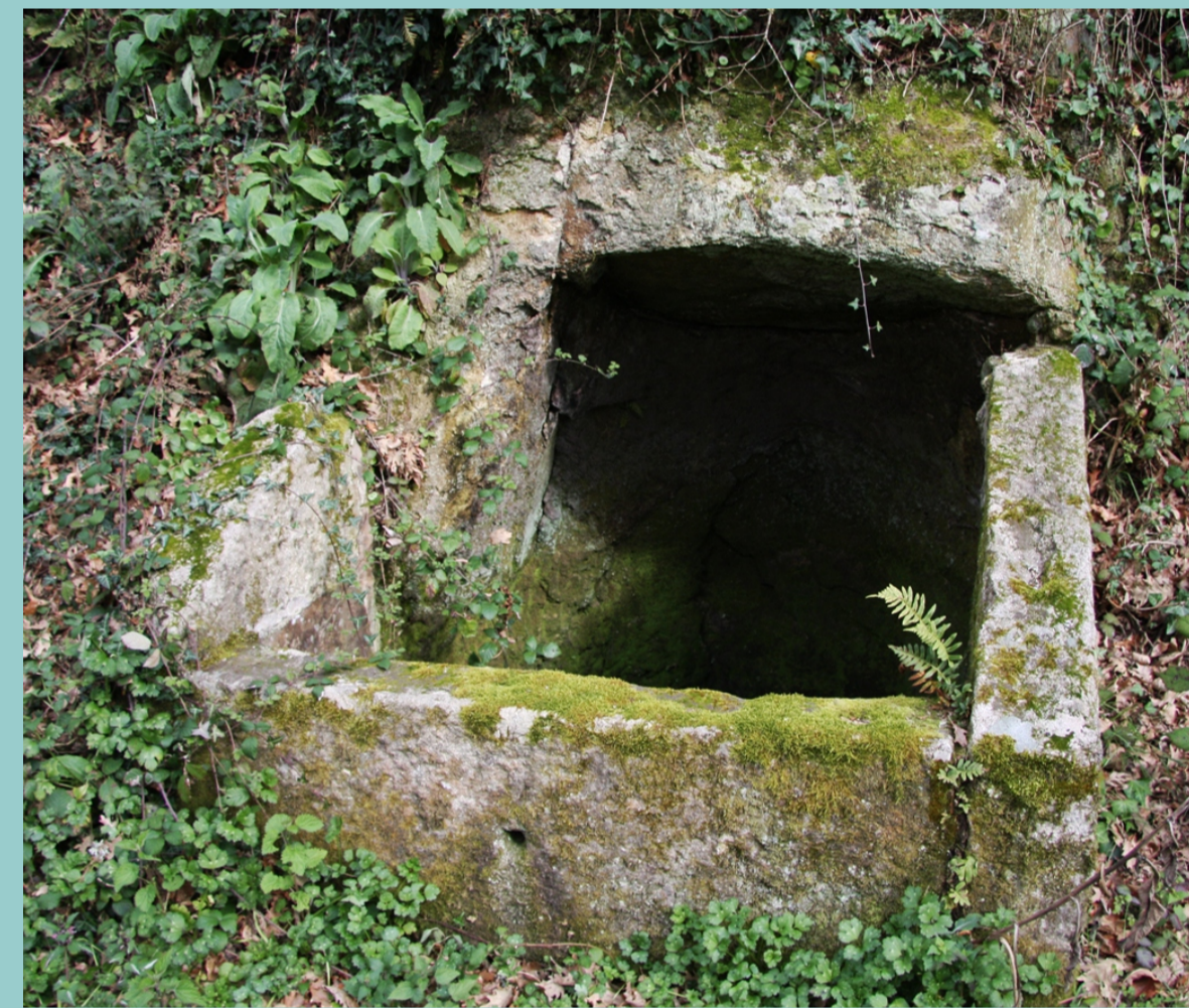
Mina en Laioso (Esgos)